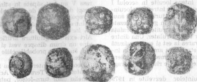
Fig. 2. Mărgelile din mormintul 1 de pe Terasa VI; mormint de incinerare; sec. I e.n.